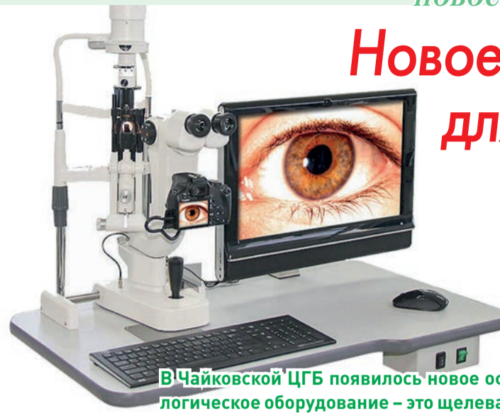
В Чайковской ЦГБ появилось новое офтальмологическое оборудование – это щелевая лампа.

– В поликлинике или стационаре все пациенты с любыми воспалительными процессами (конъюнктивит, эписклерит, попадание инородного тела или песка в глаз, ячмень) проходят через щелевой аппарат, –