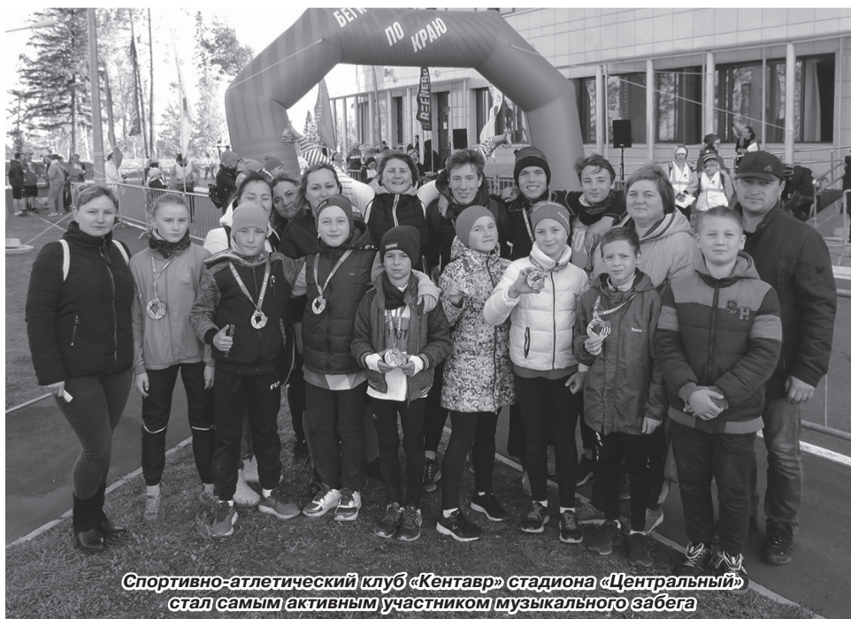
Спортивно-атлетический клуб «Кентавр» стадиона «Центральный» стал самым активным участником музыкального забега