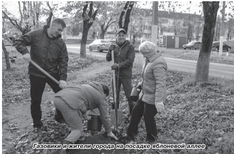
Газовики и жители города на посадке яблоневого аллею

Новую жизнь знаменитой яблоневого аллею по улице Ленина дали работники ООО «Газпром трансгаз Чайковский».