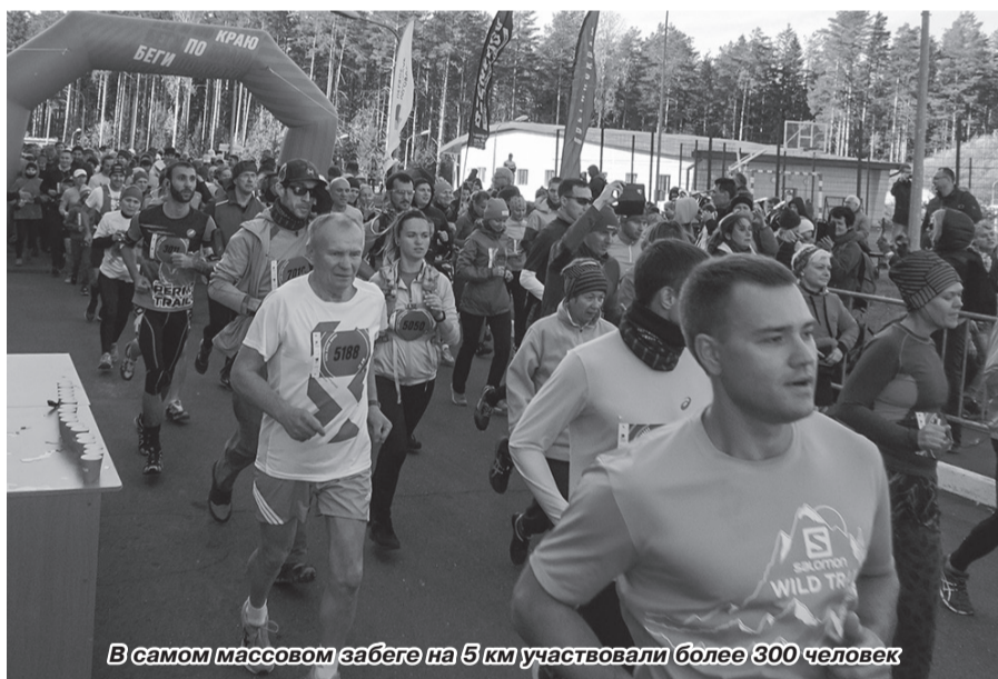
В самом массовом забеге на 5 км участвовали более 300 человек