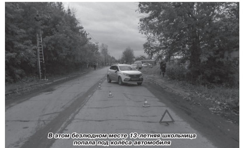
В этом безлюдном месте 13-летняя школьница попала под колёса автомобиля

Госавтоинспекция призывает всех участников дорожного движения